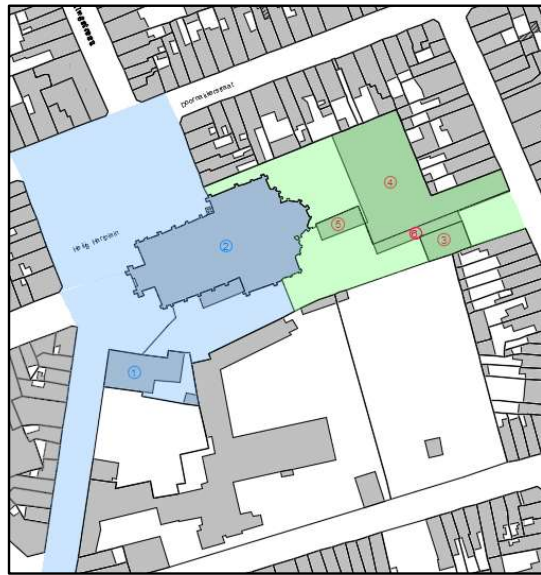
(1) pastorie; (2) Heilig Hartkerk; (3)(4)(5)(6) gebouwen Thuispunt Gent.