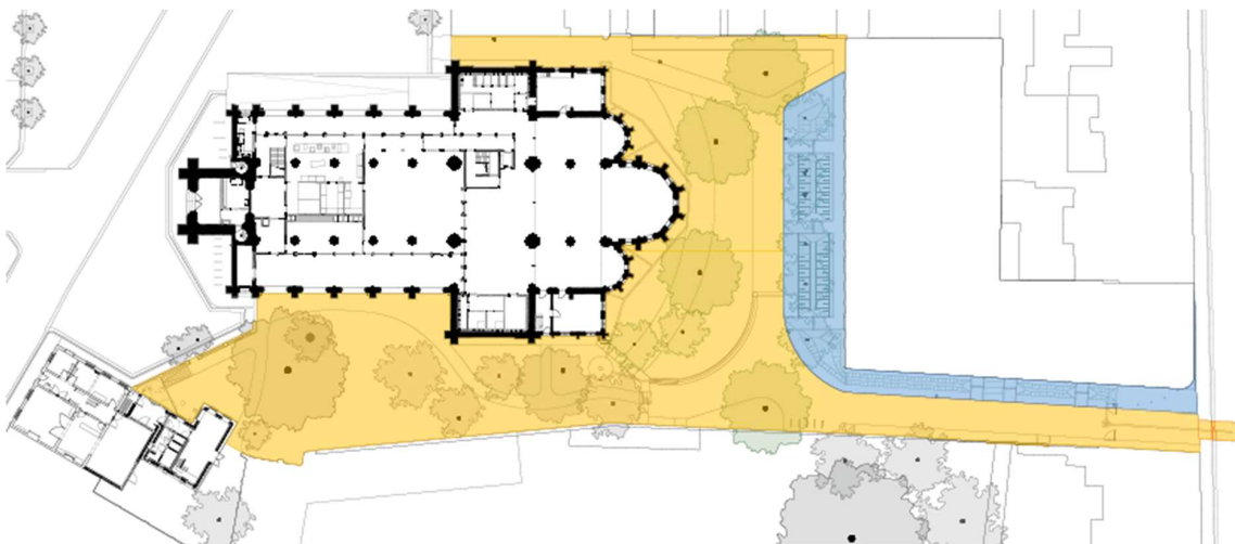
Gele zone: 60% gesubsidieerd / blauwe zone: 100% gesubsidieerd