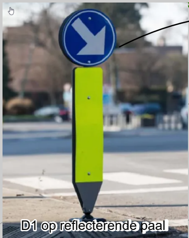
D1 op reflecterende paal