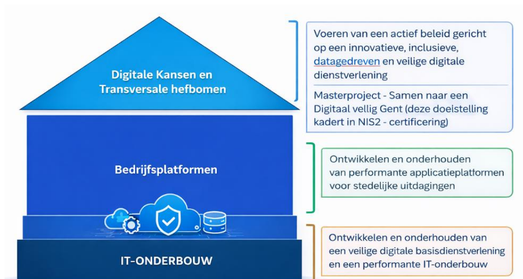
Figuur 1: Het Digitaal Huis

[ hier verschijnt automatisch de publicatiedatum ] | [ hier verschijnt automatisch de titel van het document ]