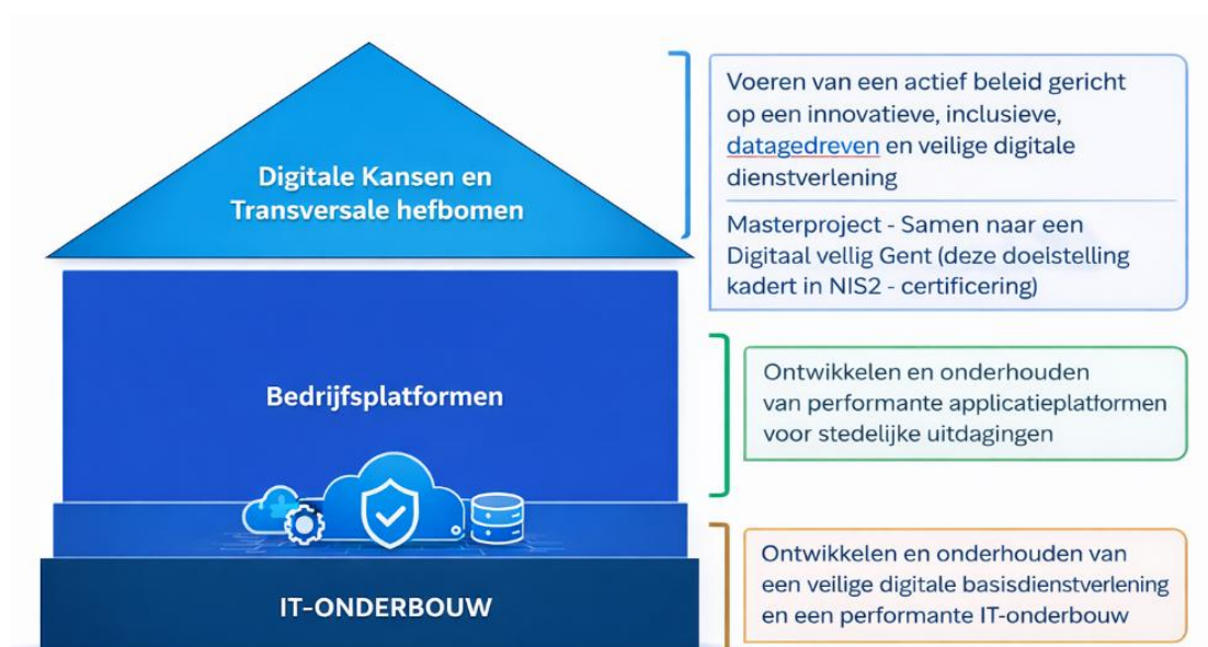
Figuur 1: Het Digitaal Huis

Deze doelstellingen zitten vervat in het 'Digitaal Huis' dat visueel een voorstelling geeft van de opdracht van District09 voor Stad Gent (zie figuur 1):