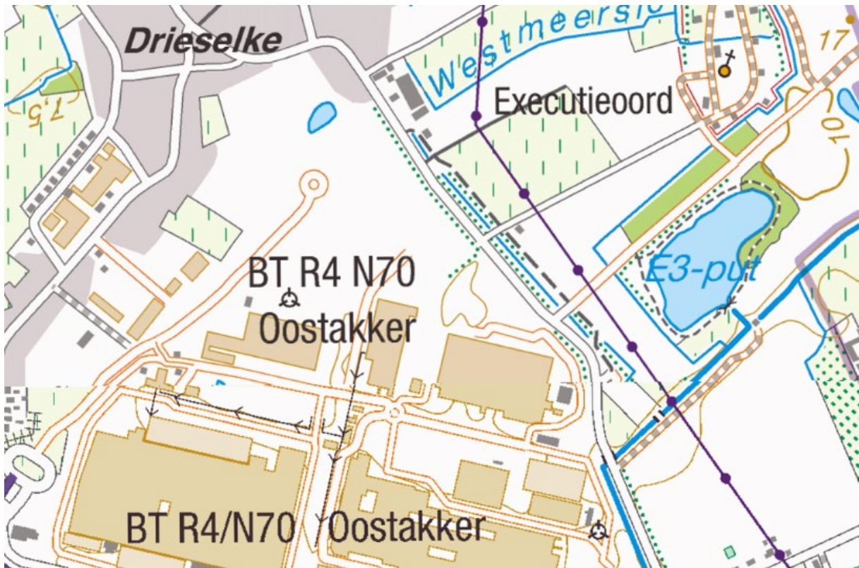
Figuur 5: Voetwegen in kwestie is hierop niet zichtbaar.