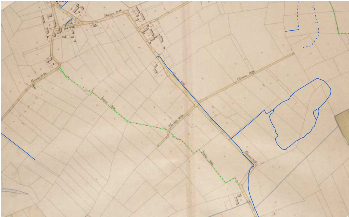
Figuur 1: Legende: - Groene stippellijn: buurtwegen - Blauwe lijnen: Huidige wegen