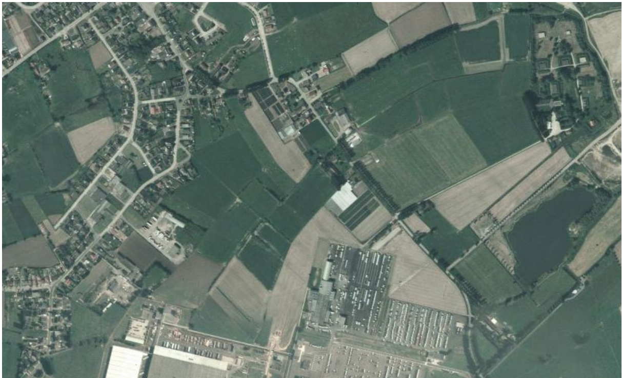
Figuur 4: Luchtfoto genomen tussen 1970 en 1990 – Voetweg in kwestie is hierop niet meer zichtbaar.