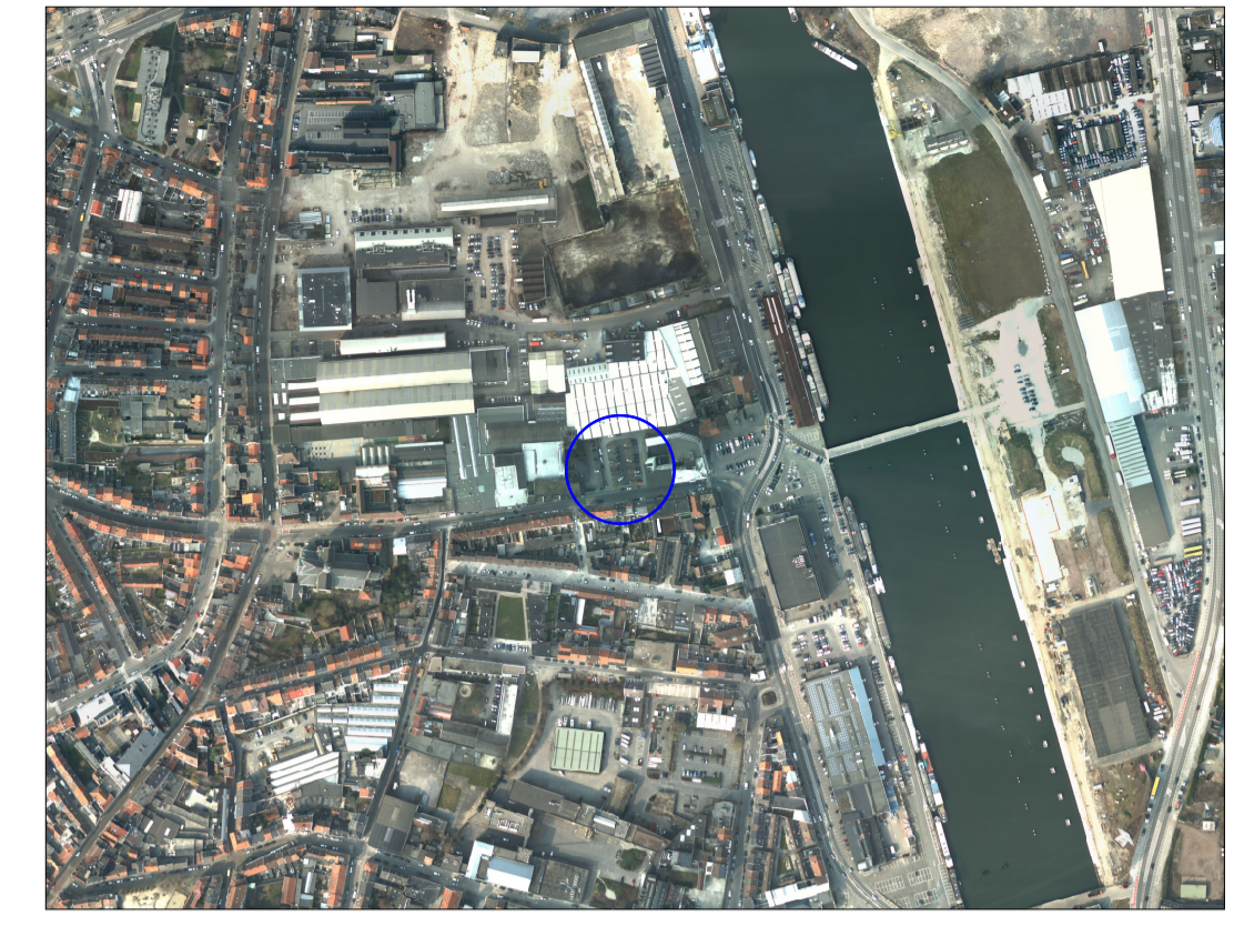
Schaal: 1/5.000