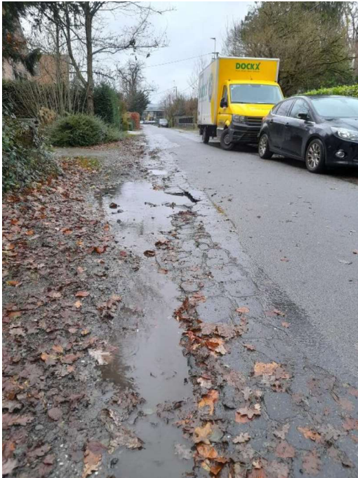
Afbeelding 2: bestaande toestand Gustaaf Carelshof