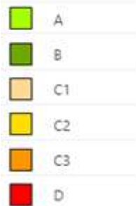
Afbeelding 4: tabel voor de breedte van de nutsvrije zone