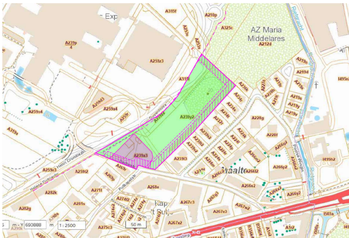
Figuur 3 - V11 met aanduiding van de percelen in eigendom van Grondbank The Loop (groene kleur) en sogent (roze kleur).

De uitbreidingszone bevindt zich op een deel van het kadastraal perceel 239y2. Thans is deze uitbreidingszone het voorwerp van een lopende (domein)concessieovereenkomst in het voordeel van de vzw Koninklijke Maatschappij voor Landbouw- en Plantkunde (de 'Floralien' genoemd), waarbij de zone – thans grotendeels overwoekerd met bosvegetatie – wordt gebruikt als stockagezone voor ca. 25.000 m 3 teelaarde t.b.v. de Floralien. Deze concessieovereenkomst, waarvan van de contour is aangeduid op het plan in bijlage 2, loopt nog tot 1 januari 2053 en zal ofwel worden stopgezet, ofwel worden gewijzigd zodat de uitbreidingszone niet langer gevat wordt binnen de omvang van de concessieovereenkomst. Sogent (via dochtervennootschap Grondbank The Loop) engageert zich ertoe om de nodige acties te ondernemen teneinde de uitbreidingszone tijdig vrij te maken voor de realisatie van de uitbreiding van de maaiveldparking (i.f.v. de projectplanning onder 2.4).