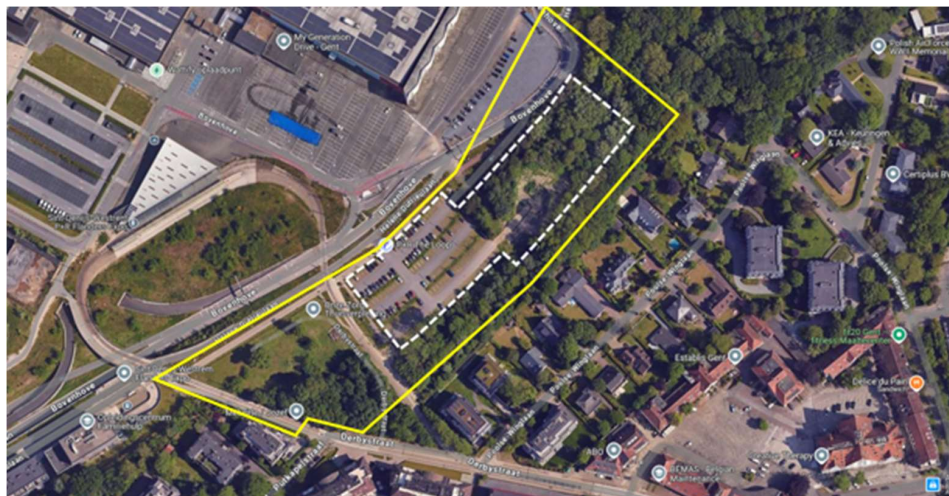
Figuur 2 – Luchtfoto met in geel de contour van V11 en in witte stippellijn het projectgebied (bestaande maaiveldparking + uitbreidingszone).

Het projectgebied waarop onderhavige overeenkomst betrekking heeft, bevindt zich binnen V11 (benaming volgens het RUP SDW-5 Handelsbeurs = zone Z2a, zijnde zone voor wonen en kantoorachtigen). V11 is een zone gelegen aan de oostrand van de gebiedsontwikkeling van The Loop. Langs de westzijde wordt de zone begrensd door de oostelijke ringweg (de Henri Crombezlaan met naastliggend de ventweg Hélène Dutrieulaan), langs de noordzijde door de natuurzone van het 'Vossenbos', langs de oostzijde door de residentiële wijk van de Poolse-Winglaan en langs de zuidzijde door de tramsporen in het verlengde van de Derbystraat en de naastliggende residentiële wijk van de Putkapelstraat. V11 behoort binnen het RUP SDW-5 Handelsbeurs tot ontwikkelingsfase 2.