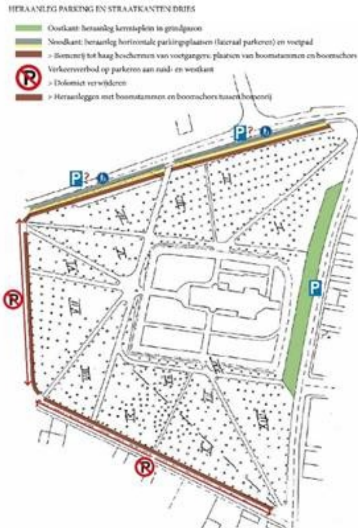
Figuur 1. Maatregelen in functie van parkeren

A. Op IKZ is afgesproken om de schuine parkeerplaatsen aan de noordelijke zijde van de Vroonstalledries (zijde Woestijngoedlaan) om te vormen naar langsparkeren. Dit om volgende redenen: