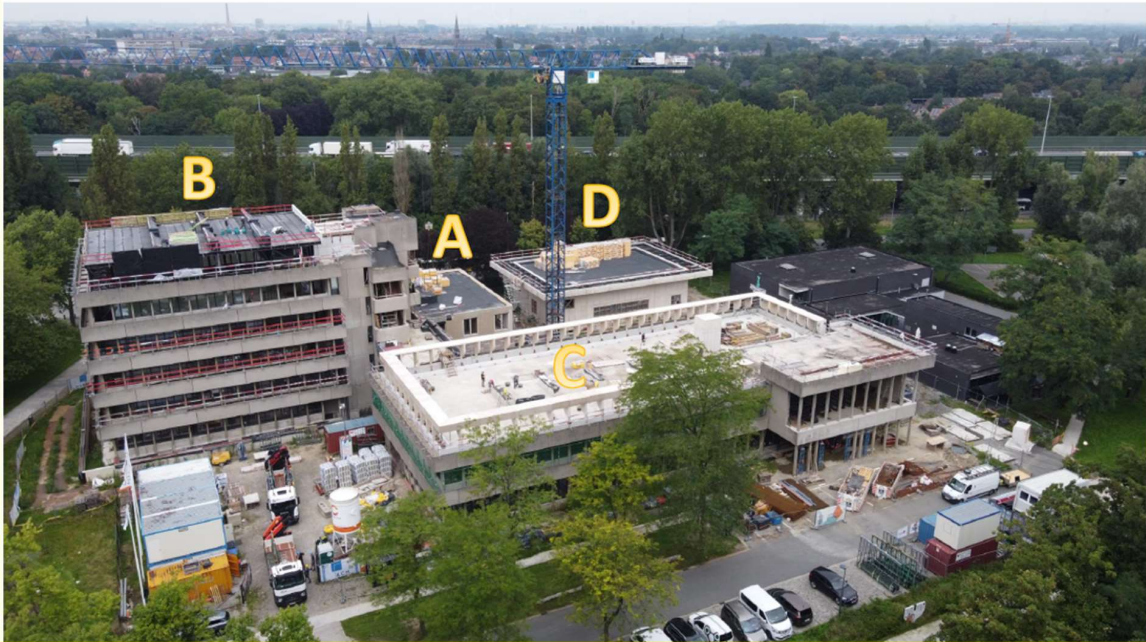
volledige site Felix