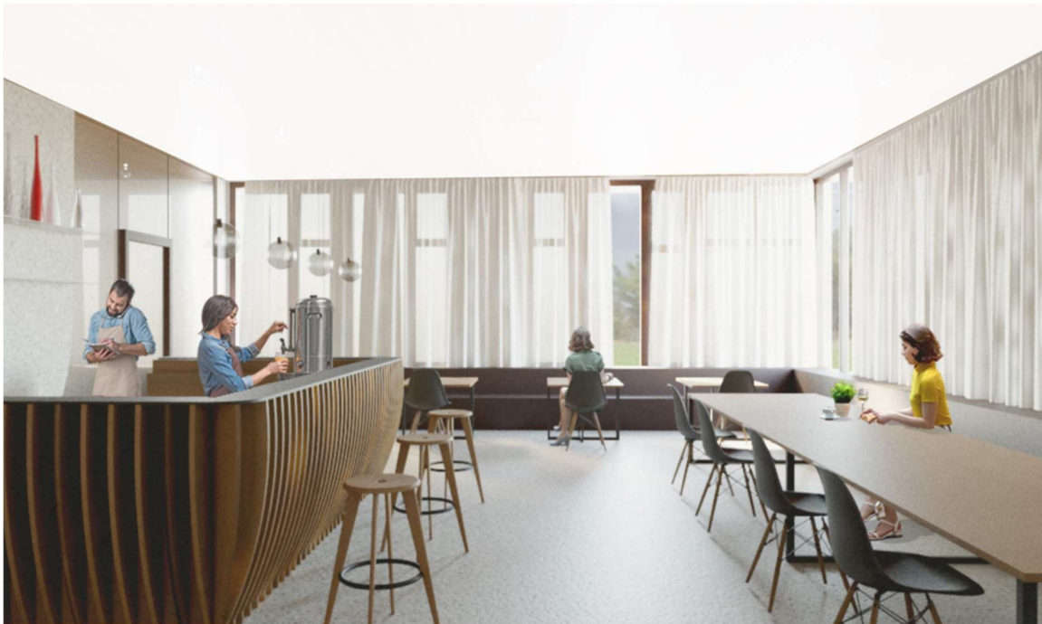
Een impressie van hoe het Felixcafé er zal uitzien. © BV Atama

Concessieverlenende instantie: Stad Gent, Botermarkt 1, 9000 Gent, offertes.vastgoed@stad.gent