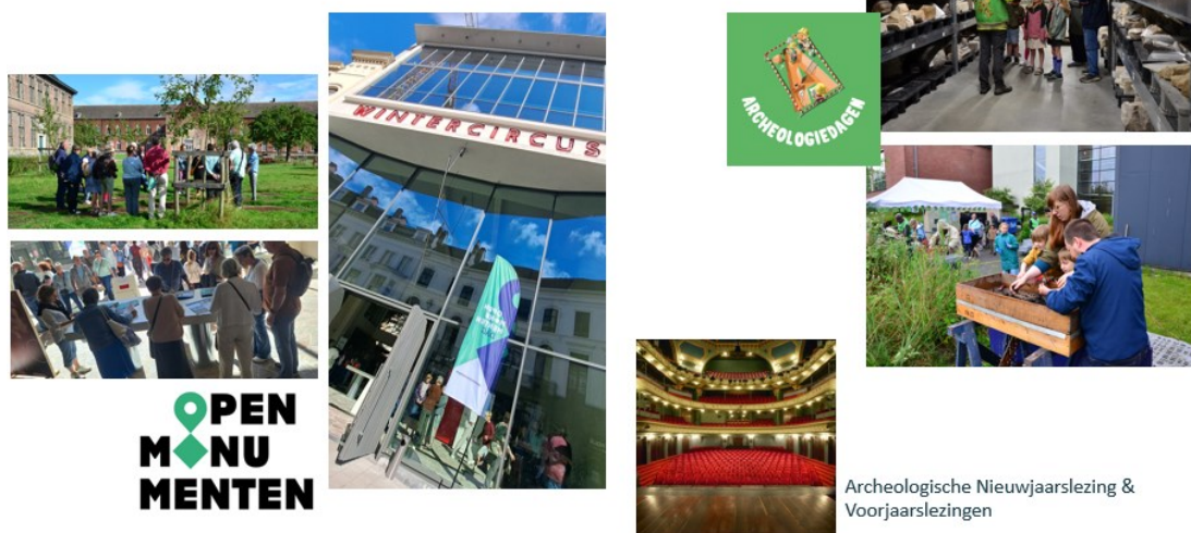
Archeologische Nieuwjaarslezing & Voorjaarslezingen

Zo organiseert de dienst jaarlijks 4 gratis lezingen. Een Nieuwjaarslezing, bij het begin van het jaar, waar steeds een archeologisch onderwerp met een sterke link naar de geschiedenis van de Stad, aan bod komt. Daarnaast zijn er 3 lezingen in het voorjaar die een voor de Stad actueel erfgoedthema- of dossier belichten.