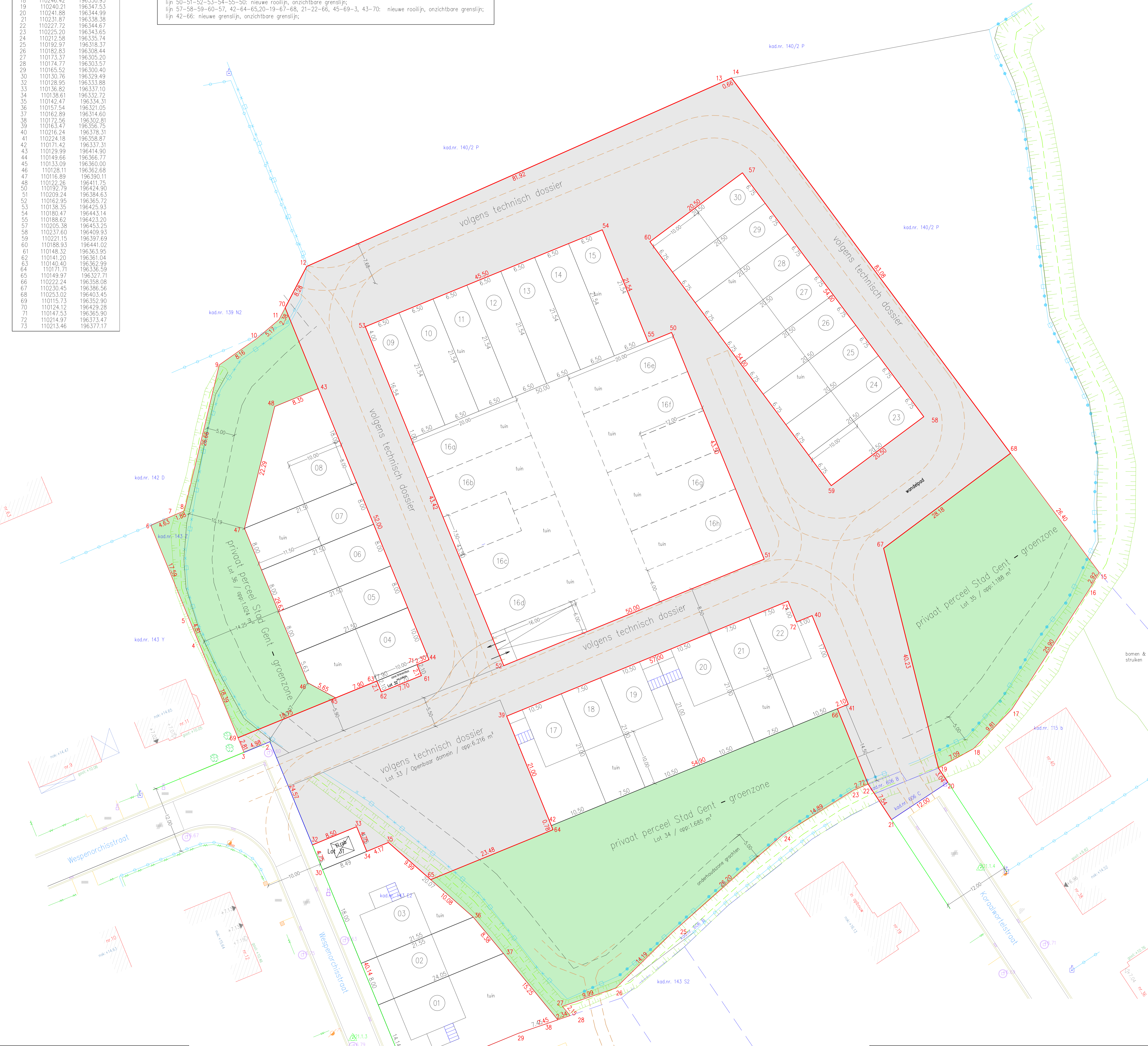
OVERZICHTSPLAN - SITUATIEPLAN - SCHAAL 1/10.000

Beschrijving van de grenzen: lijn 1-30-32: volgens ligging bestaande rooilijn, onzichtbare grenslijn; lijn 32-2-3: volgens ligging bestaande rooilijn, af te schaffen, onzichtbare grenslijn; lijn 69-4-5-6-7-8-9-10-11-70: volgens plan Eyckmans, d.d. 14.06.2018, onzichtbare grenslijn; lijn 70-12-13-14: volgens plan Eyckmans, d.d. 14.06.2018, onzichtbare grenslijn; nieuwe rooilijn; lijn 14-68: volgens bestemmingsgrens, afbakening grootstedelijk gebied Gent, woongebied Achtendries 1, nieuwe rooilijn lijn 68-15: volgens bestemmingsgrens, afbakening grootstedelijk gebied Gent, woongebied Achtendries 1 lijn 15-16-17-18-19: volgens as gracht; lijn 20-21: volgens plan Eyckmans, d.d. 14.06.2018, onzichtbare grenslijn; af te schaffen; lijn 22-23-24-25-26-27: volgens plan Eyckmans, d.d. 14.06.2018, onzichtbare grenslijn; lijn 27-28-29-1: volgens plan Eyckmans, d.d. 14.06.2018, deels onzichtbaar, deels volgens ligging afsluiting; lijn 32-33-34-35-65: nieuwe rooilijn, onzichtbare grenslijn; lijn 65-36-37-38: onzichtbare grenslijn; lijn 42-39-40-41-66: nieuwe rooilijn, onzichtbare grenslijn; lijn 43-44-71-61-62-63-45: nieuwe rooilijn, onzichtbare grenslijn; lijn 45-46-47-48-43: onzichtbare grenslijn; lijn 50-51-52-53-54-55-50: nieuwe rooilijn, onzichtbare grenslijn; lijn 57-58-59-60-57, 42-64-65, 20-19-67-68, 21-22-66, 45-69-3, 43-70: nieuwe rooilijn, onzichtbare grenslijn; lijn 42-66: nieuwe grenslijn, onzichtbare grenslijn;