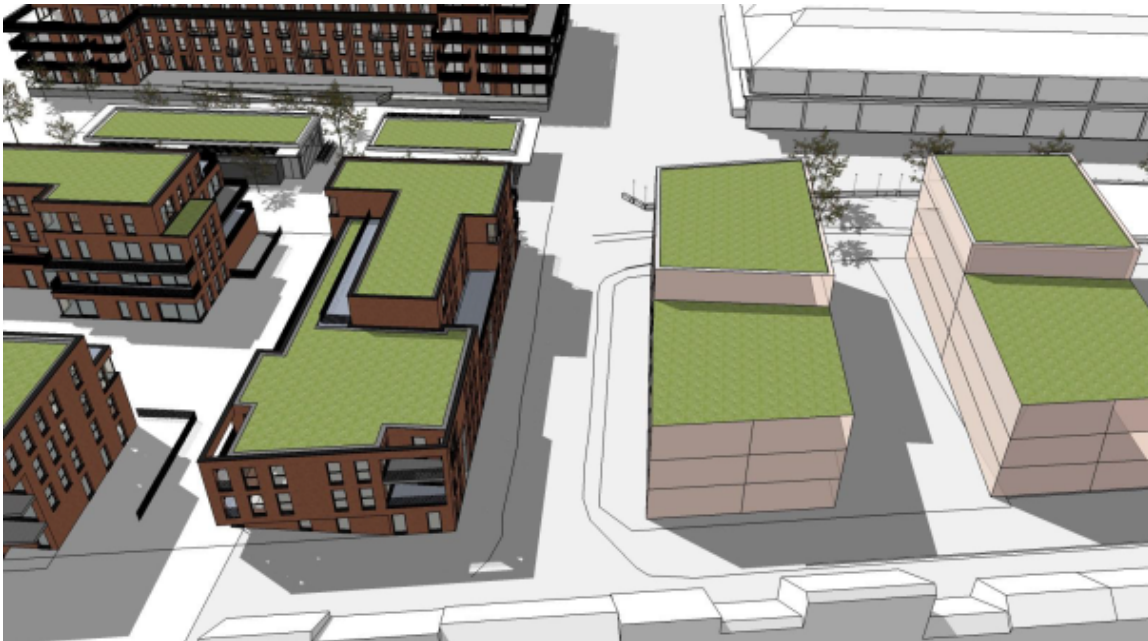
zicht van de nieuwbouw volgens de nieuwe rooilijn (Z4) in het RUP

De aanvraag tot sloop laat toe om - in een volgende aanvraag - nieuwbouwvolumes te zetten in de zone Z1c die de nieuwe rooilijn van het RUP Voorhaven Loods 20 volgen, en geeft daarmee uitvoering aan de voorschriften van het RUP.