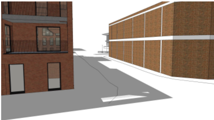
huidig zicht naar loods 20

De beelden hieronder tonen de visibiliteit van loods 20 in de Voorhavenlaan en het doorzicht naar de Londenstraat, zowel in de huidige toestand als in de mogelijks nieuwe toestand. De nog niet gebouwde volumes zijn suggestief volgens wat toegelaten is binnen de voorschriften van het RUP.