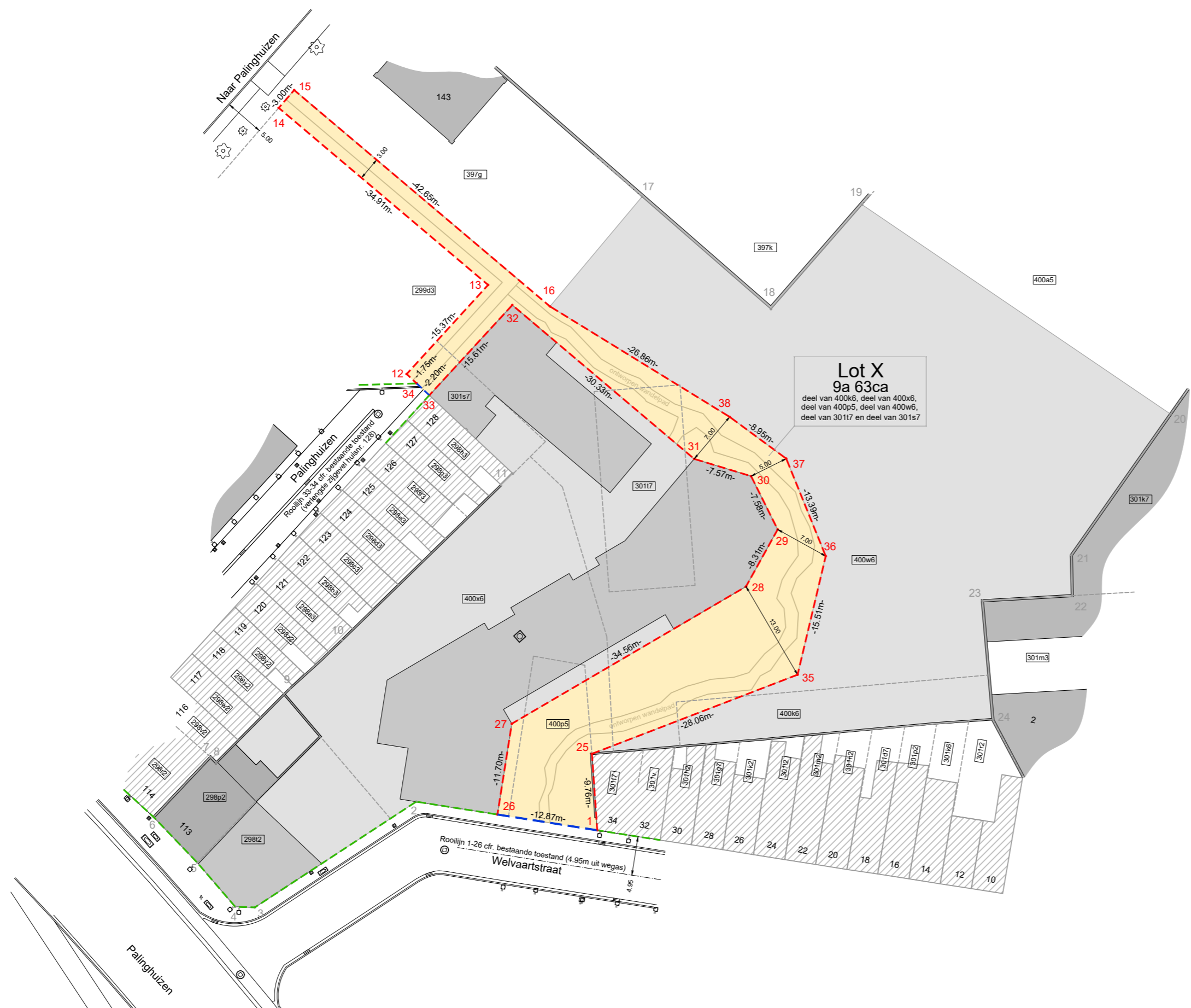
Rooilijnplan schaal: 1/500