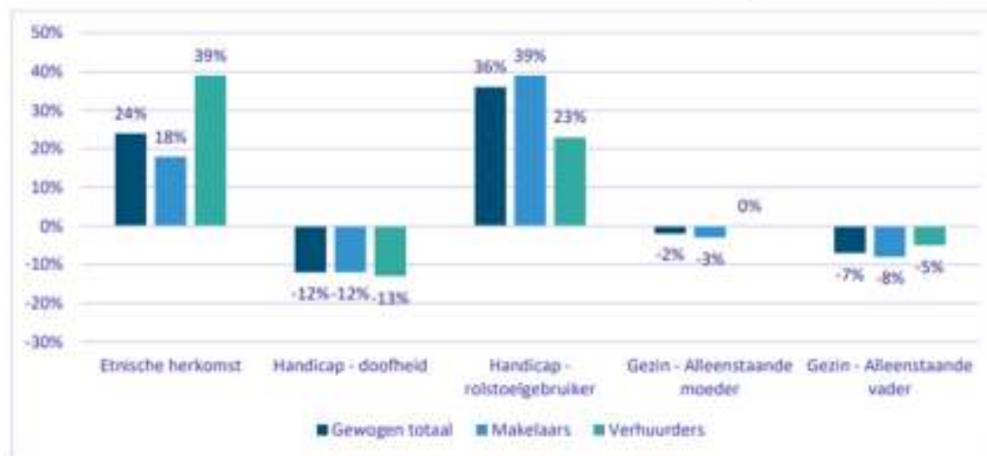
Figuur 3.3.1. Nettodiscriminatiegraden per discriminatiegrond op de volledige private huurwoningmarkt