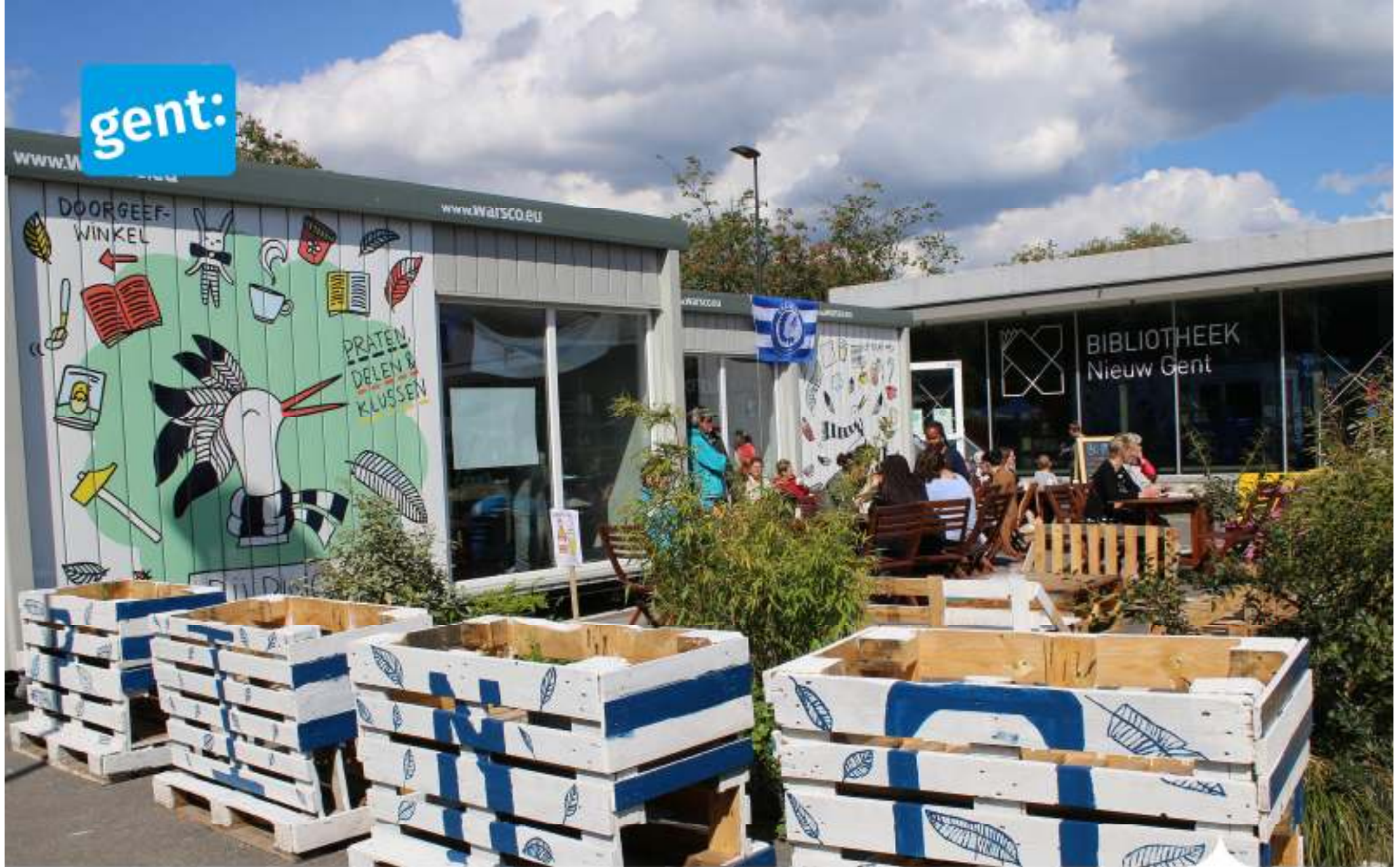
Fonds Tijdelijke Invulling: evaluatie en blik vooruit