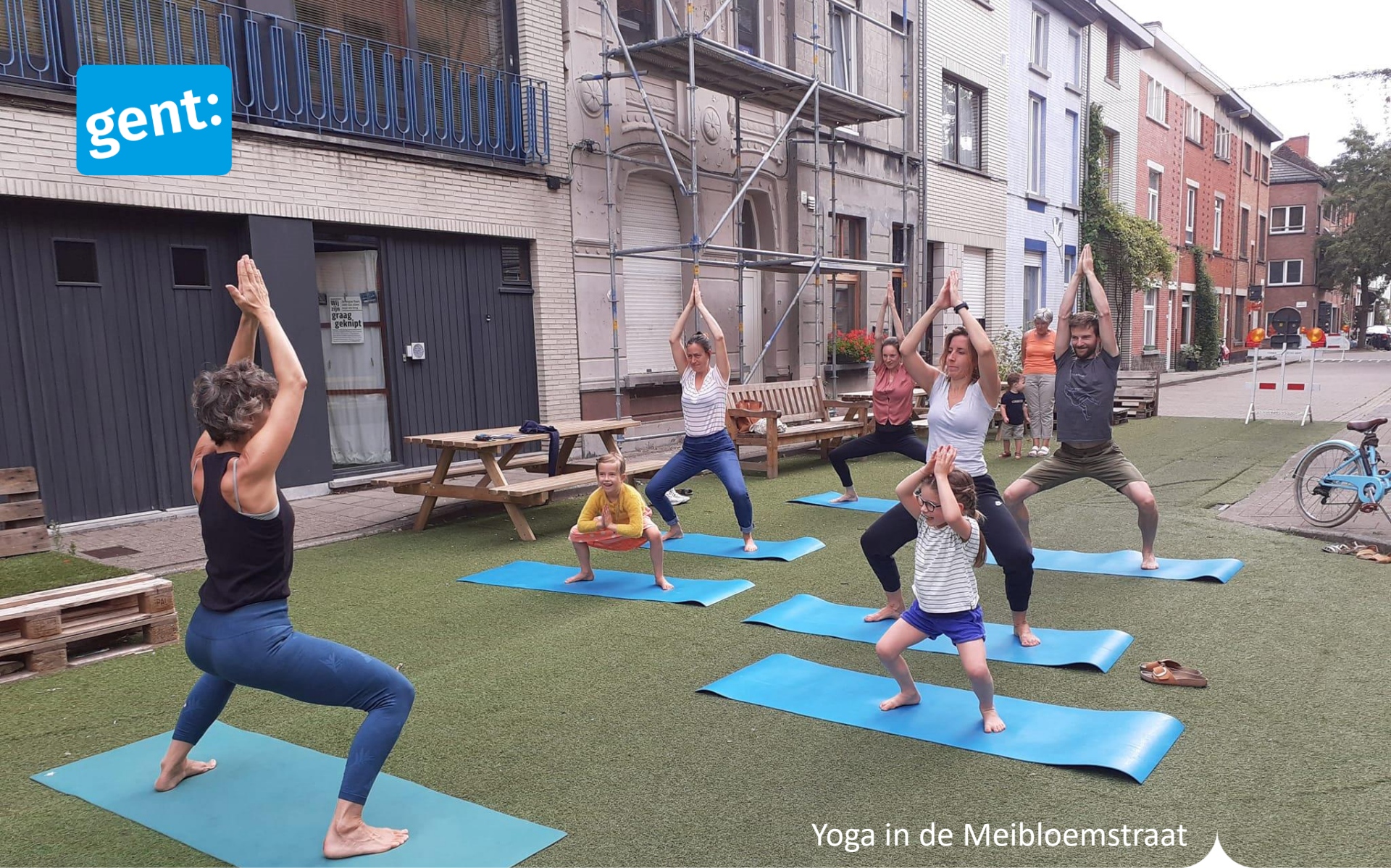
Yoga in de Meibloemstraat