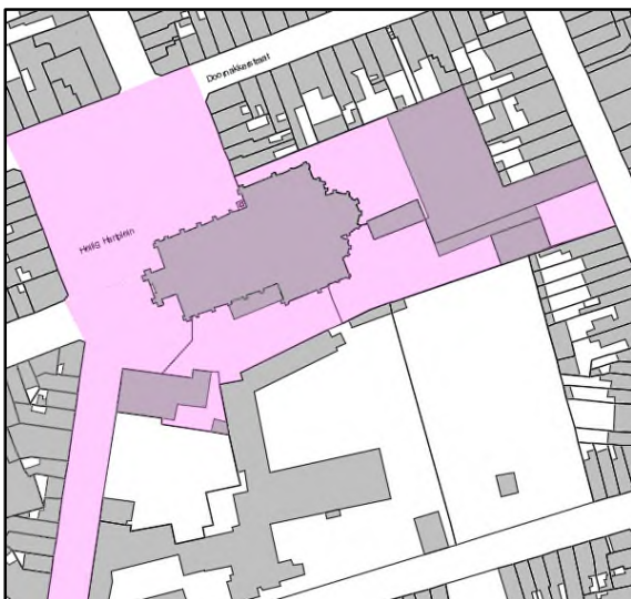
Figuur 1: Projectsite Heilig Hart conform BSO1.

Vervolgens werd in BSO3 een fasering opgenomen van dit projectgebied: de site werd opgedeeld in zones 1A, 1B en 2. De studiefase zou enkel over zone 1A gaan en in beperkte mate (concept) over zone 1B.