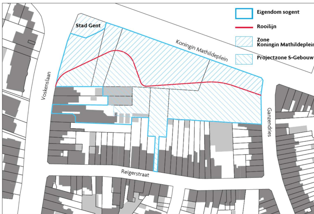
Figuur 2 – eigendom sogent

Sogent is conform de BSO “Sint- Denijsplein, voorbereiding, verwerving en sloop” op heden eigenaar van alle delen binnen het projectgebied, nodig voor de realisatie van het S-gebouw en het Koningin Mathildeplein (fase 1), zoals hieronder met blauwe vette lijn aangeduid: