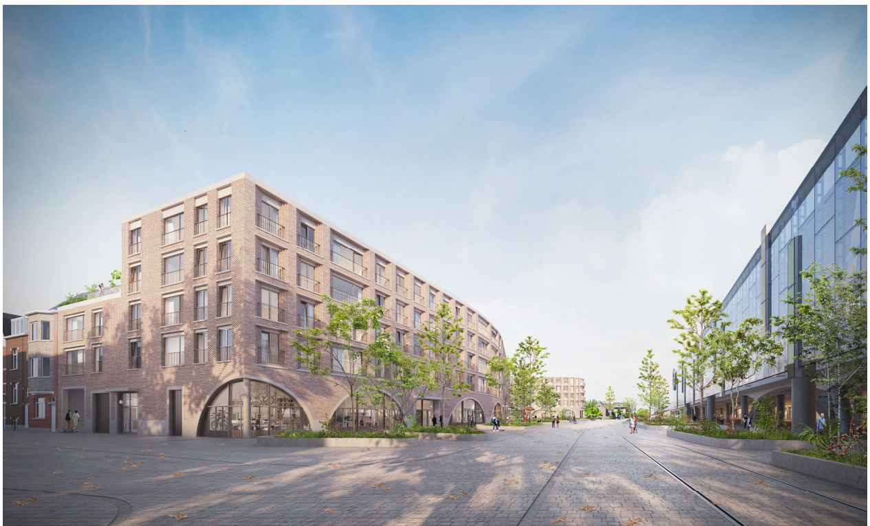
3D-simulatie S- gebouw, hoek met Ganzendries, Acasa – 360-architecten (2021)