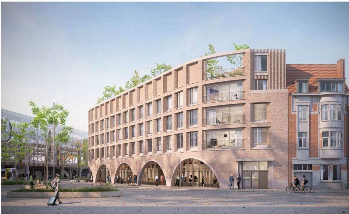
3D-simulatie S- gebouw, hoek met Voskenslaan, Acasa – 360-architecten (2021)

Sogent heeft bij besluit van de raad van bestuur van 24 juni 2021 de realisatie van het S-gebouw definitief toegewezen aan Acasa Group bv met maatschappelijke zetel te 9830 Sint-Martens-Latem, Kortrijksesteenweg 62, conform het gecoördineerd bestek 2016/13.