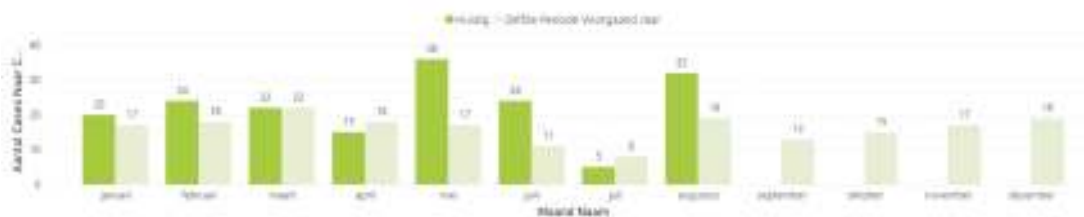
Tendens leningadvies per maand

Hieronder een overzicht van het aantal volledige aanvragen van Energieleningen. In dit overzicht werden de onvolledige of vroegtijdig geannuleerde aanvragen niet meegenomen.