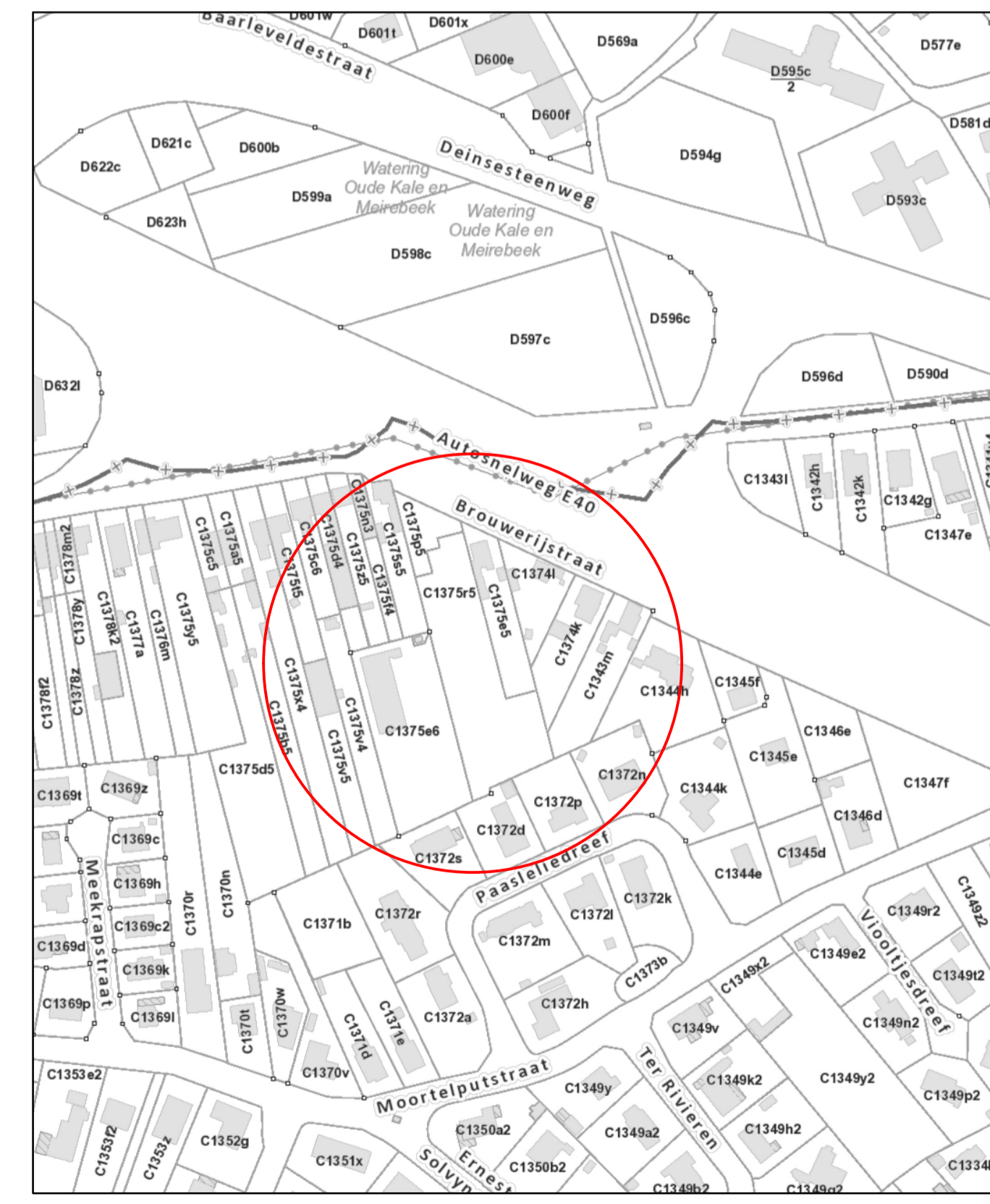
Uittreksel kadastrplan (schaal : 1/2.500)