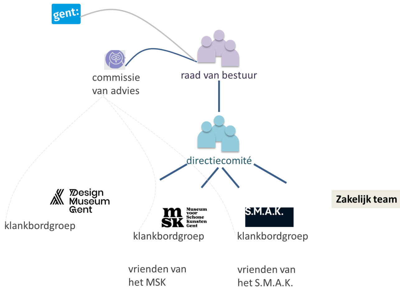
Figuur 1: organogram van het AGB Kunsten en Design

In onderstaande tabel is een overzicht terug te vinden van de geraamde personeelsbezetting waarop het budget voor het meerjarenplan gebaseerd is.