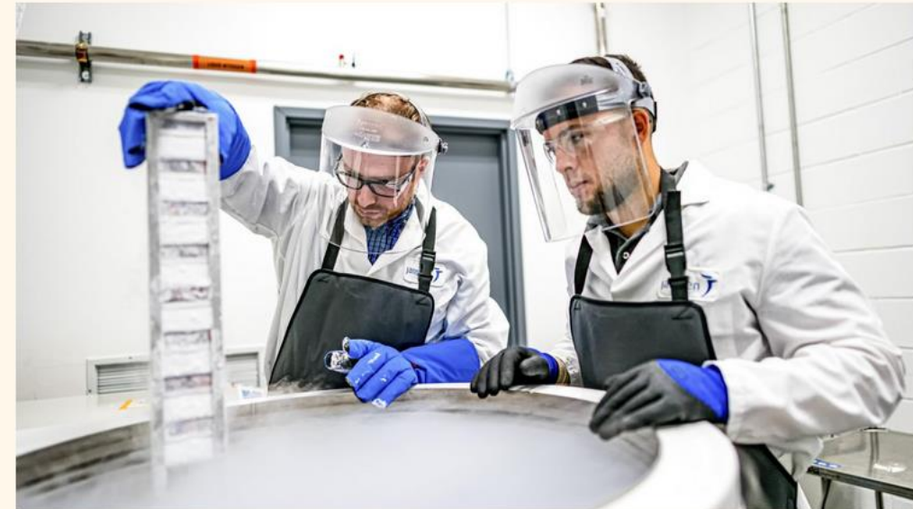
Medewerkers van J&J produceren de bloedkankertherapie in de Verenigde Staten voor klinische studies.