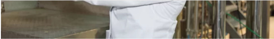
Minister Crevits neemt zelf een staal af in de pilootfabriek.