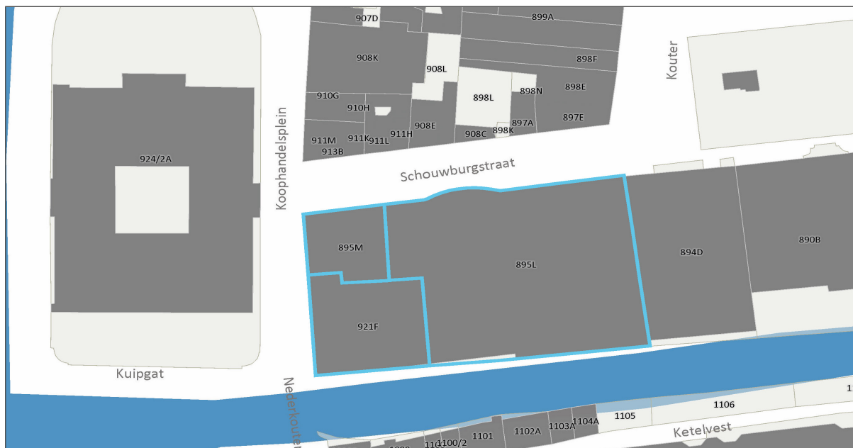
Figuur 2 - eigendomsverdeling