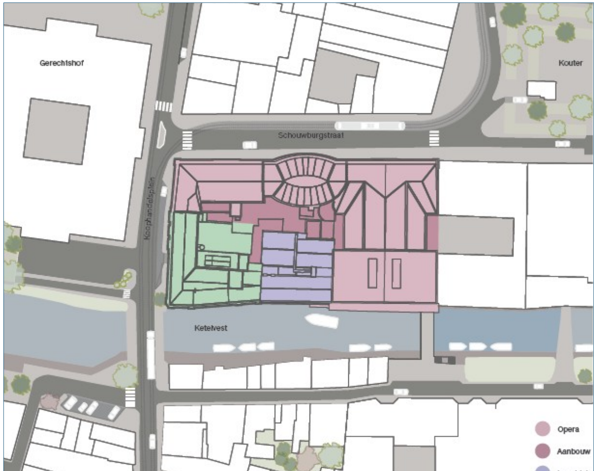
Figuur 1 - omgevingsplan