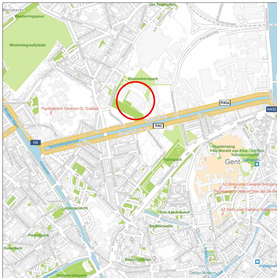
Figuur 1 - omgevingsplan