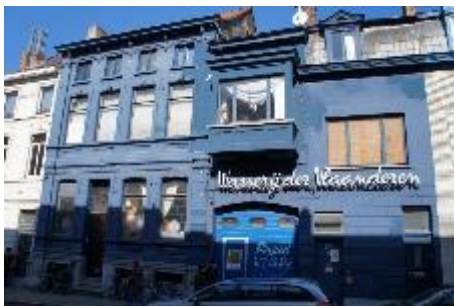
Voorgevel Toekomststraat bestaand