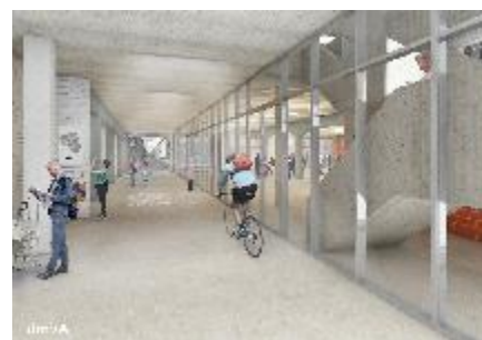
Nieuwe binnenstraat Wasserij