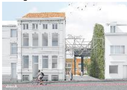
Gerenoeverde voorgevel herenhuis Toekomststraat