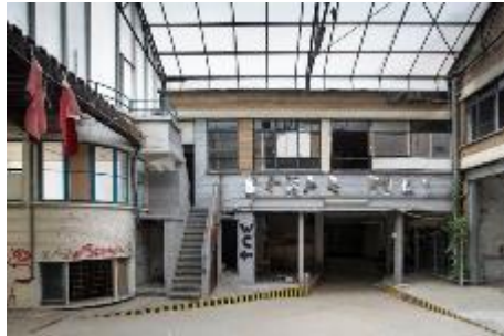
Bestaand binnengebied en loodsen