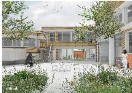
Nieuw vergroend binnengebied