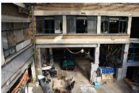
Binnengevel bestaande Wasserij