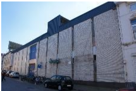
Bestaande voorgevel Wasserij Kunstenaarstraat