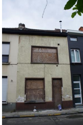
Van den Heckestraat 80