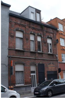
Eendrachtstraat 123 en 125