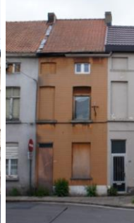
Vredestraat 50/52 - Jan Delvinlaan 120 - Fazantstraat 10 - Fonteineplein 28 - Huidevetterken 27 - Landbouwersstraat 49