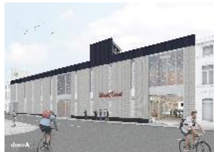
Gerenoeverde voorgevel Wasserij