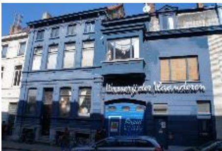
Voorgevel Toekomststraat bestaand