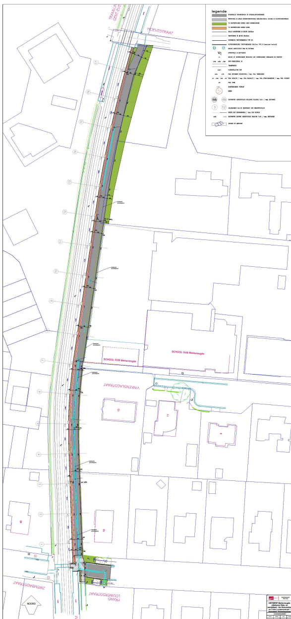
Kaart I: Ontwerp

De projectzone bevindt zich in de deelgemeente Wondelgem, meer bepaald langsheen de tramspoorlijn Gent-Evergem, tussen de Frans de Louwersstraat en de Hoevestraat. Het project betreft de realisatie van een fiets- en wandelpad van 3m90 breed, die de bereikbaarheid van de school GVB Mariavreugde en de tramhaltes en de doorbaarheid van de buurt sterk zal verbeteren.