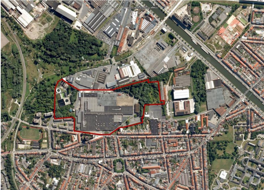
luchtfoto met aanduiding van de door sogent aangekochte UCO-site