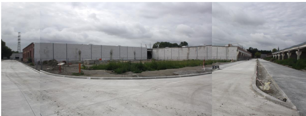
Foto dd. 28 juli 2017, na sloop en met aanleg wegenis rondom

Intussen zijn studies volop lopende door o.a. het ontwerpteam en controlebureau.