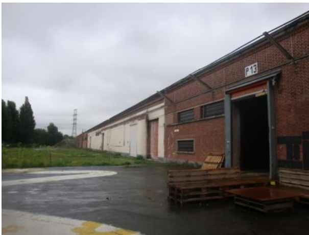
Zijgevel bestaande loods (voor afbraak Getouwstraat en deel Parkeergebouw)

Het heeft een oppervlakte van 2.460 m 2 en is deel van het kadastraal perceel sectie K, nr. 28K deel, lot 5. Zie 1.2 Situering van het project en bijlage 1.