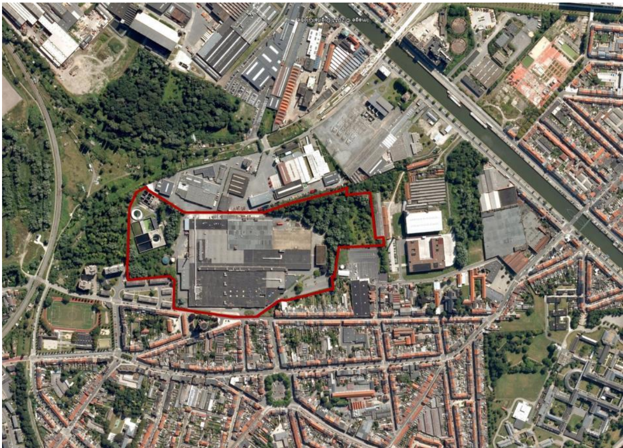
luchtfoto met aanduiding van de door sogent aangekochte UCO-site

De UCO site, Maisstraat 142 te Gent, situeert zich ten noorden van Gent en maakt deel uit van het groter gebied tussen de Nieuwevaart in het zuiden en de Wondelgemse Meersen in het noorden en is gelegen aan de oostrand van de Bloemekenswijk.