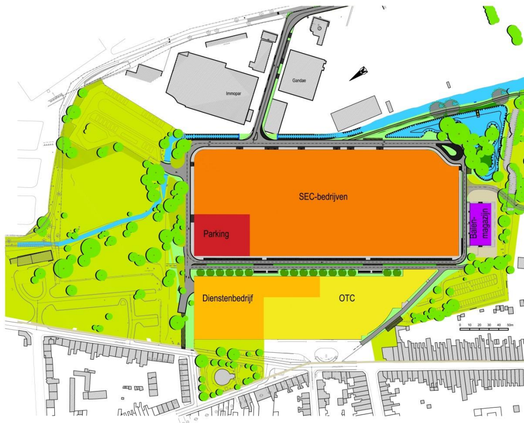
plan wegenisanaanleg met aanduiding van de zones op de UCO-site