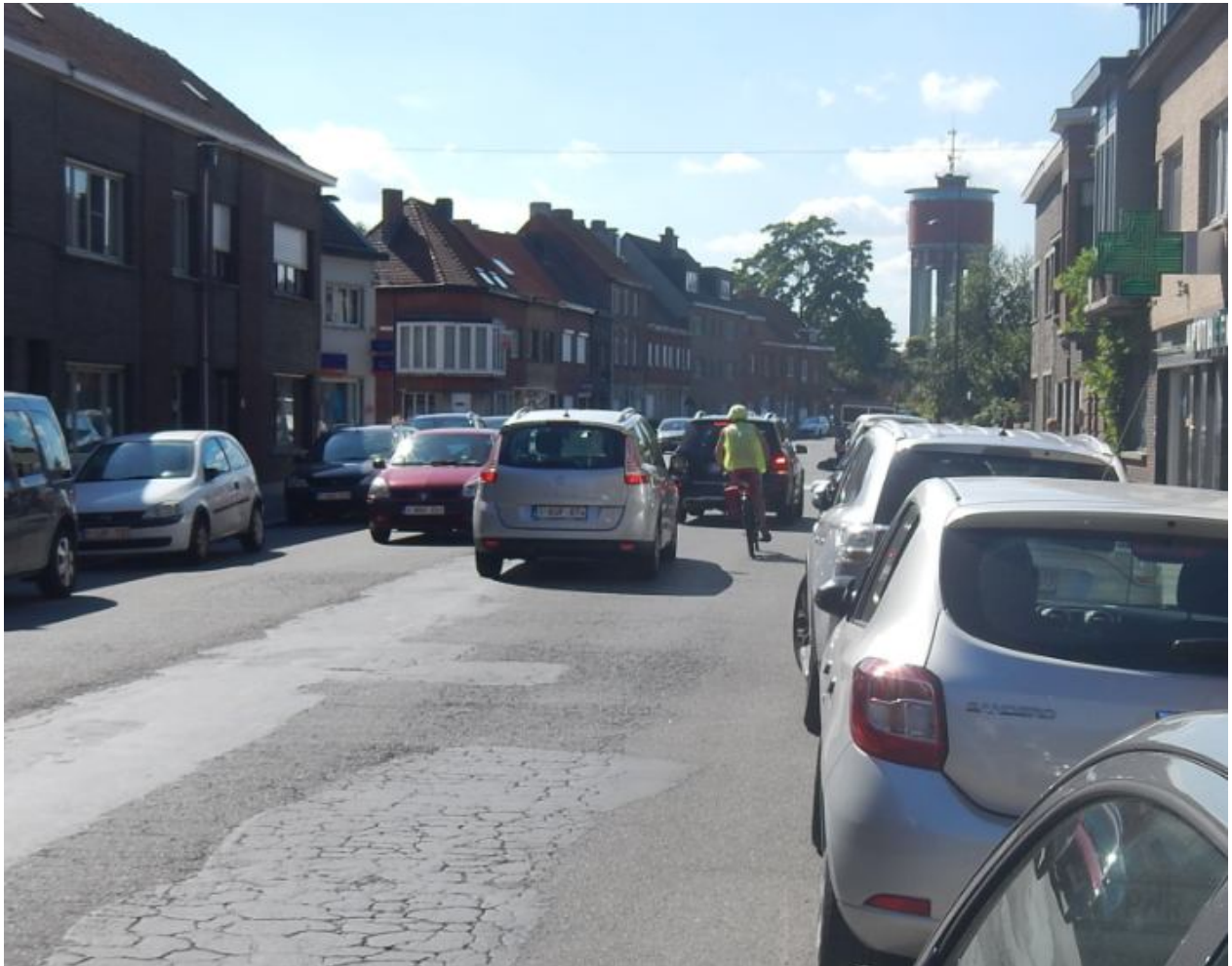
Conflict fietsers vs wagens

Bovendien is het wegdek dringend aan herstelling toe. Vandaag zijn er verschillende scheuren en putten in het wegdek.