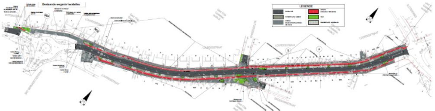
Figuur 1 : Grondplan Wegenis

Onderstaand is het grondplan (figuur 1) en een typedwarsprofiel (figuur 2) van de ontworpen weg weergegeven.