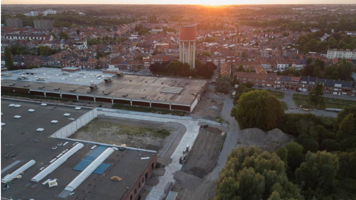
luchtfoto met aanleg nieuwe wegenis en vrijgemaakte zone in de UCO-loods voor het parkeergebouw

wordt het doorkruisen van de Bloemekenswijk vermeden en kan vooraan de UCO-site een autovrij plein gecreëerd worden.