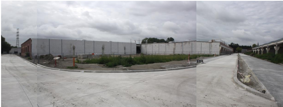
Foto dd. 28 juli 2017, na sloop en met aanleg wegenis rondom