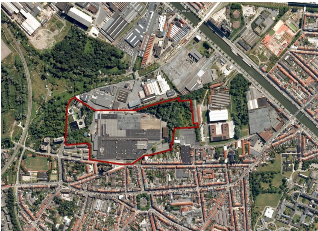
luchtfoto met aanduiding van de door sogent aangekochte UCO-site