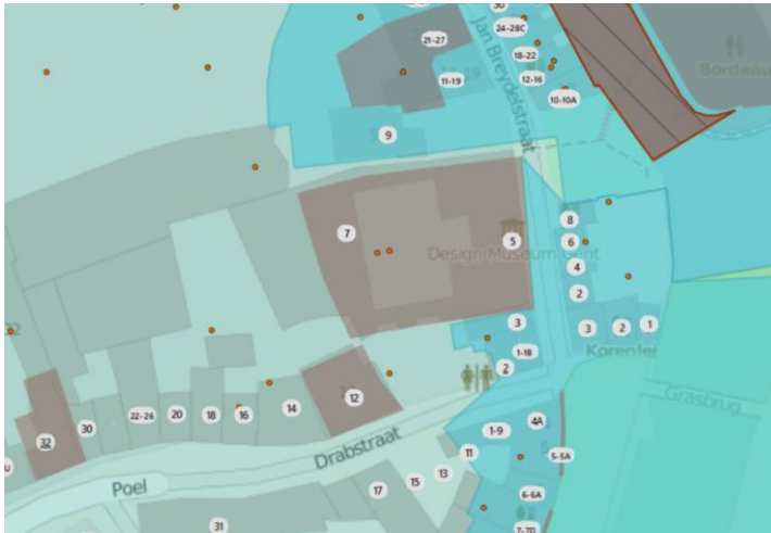
uit Geoportaal Onroerend Erfgoed